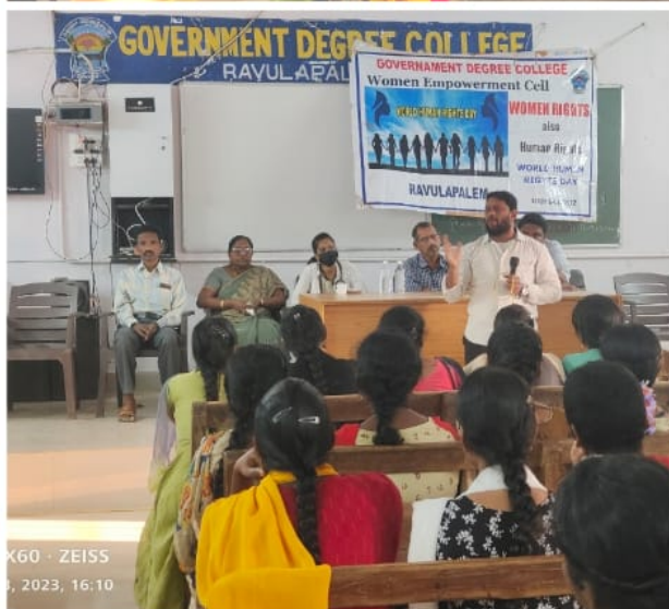
X60 · ZEISS 3, 2023, 16:10