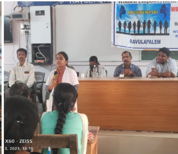
X60 · ZEISS 3, 2023, 16:16