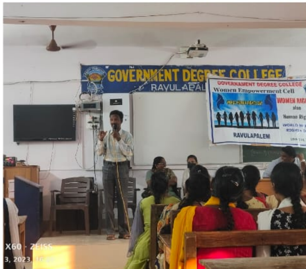
X60 · ZEISS 3, 2023, 16:10