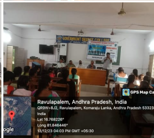
X60 · ZEISS 3, 2023, 16:10

Ravulapalem, Andhra Pradesh, India QR9W+8J2, Ravulapalem, Komaraju Lanka, Andhra Pradesh 533230 India Lat 16.768226° Long 81.846446° 13/12/23 04:03 PM GMT +05:30