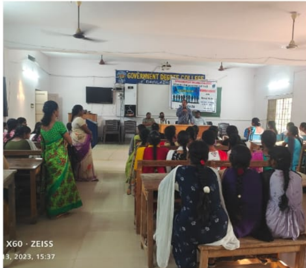
X60 · ZEISS 3, 2023, 15:37