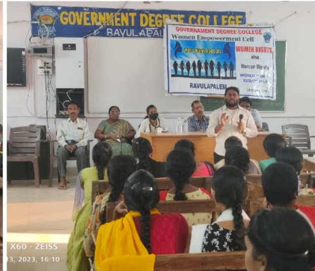
X60 · ZEISS 3, 2023, 16:10